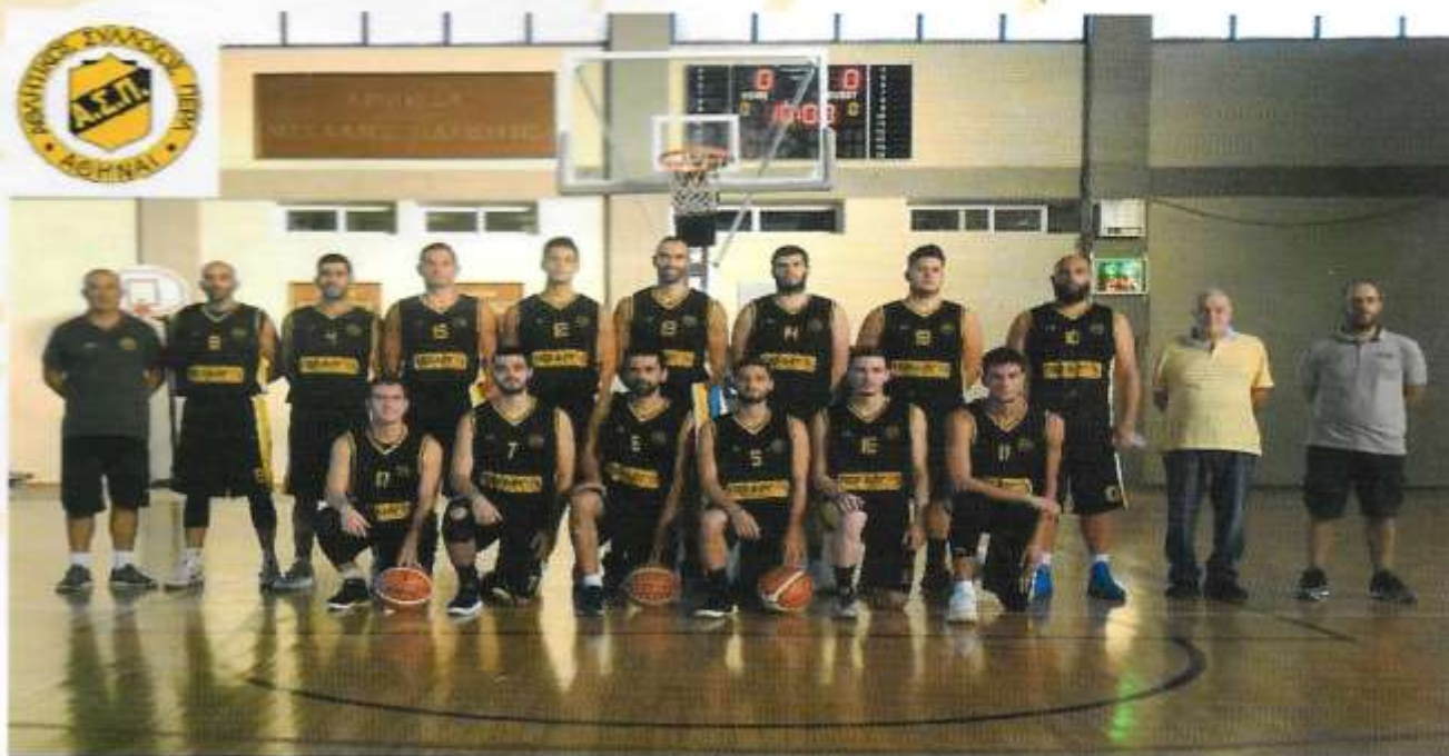
Η ανδρική ομάδα του Α.Σ.ΠΕΡΑ 2018 - 19

Η ομάδα μας, ωστόσο, με χαμηλό συγκριτικά προϋπολογισμό, κατόρθωσε τα τελευταία χρόνια νά πρωταγωνιστήσει στο πρωτάθλημα της Α' ΕΣΚΑΝΑ και φέτος να επίβραβευτεί με την άνοδο της στην Γ' Εθνική Κατηγορία. Και τώρα "επί τω έργω"! Καλούμαστε ΟΛΟΙ, παίκτες, προπονητές, διοίκηση και βέβαια οι φίλαθλοι μας, ο καθένας στο μέτρο του δυνατού και της αρμοδιότητας του, να αντιμετωπίσουμε την ωραία αυτή πρόκληση με αισιοδοξία και αυτοπεποίθηση, έμπρακτα και κυρίως κατανοήση. Είναι μια δύσκολη «αποστολή», που πρέπει να τη φέρουμε σε πέρας. Καλή επιτυχία στην ομάδα μας !!