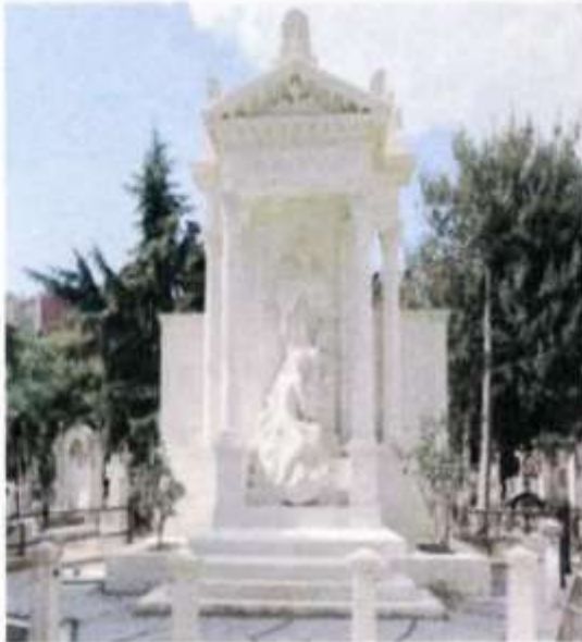
Το ωραιότερο ίσως ταφικό μνημείο ανήκει στην οικογένεια Ζοριφίη.

Δεν ήταν μόνον η φθορά του χρόνου και η απίσχναση της κοινότητας που απειλούσε αυτό το υπαίθριο μνημείο γλυπτικής. Ήταν και η μανία του όχλου το 1955 που είχε αφήσει πίσω της μεγάλες πληγές. Παράλληλα, δεν πρέπει κανείς να ξεχνά ότι το νεκροταφείο βρίσκεται ουσιαστικά στην καρδιά της πόλης, δίπλα στο μεγαλύτερο εμπορικό κέντρο του ισλαμικού κόσμου, το Cevahir, και θα ήταν το ιδέως «φύλετο» για κάθε κατα-