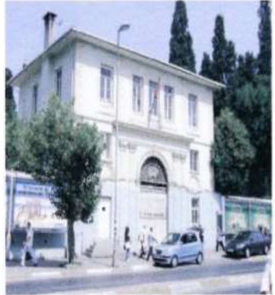
Η είσοδος του Ορθόδοξου Κοιμητηρίου στην περιοχή Σισλι.