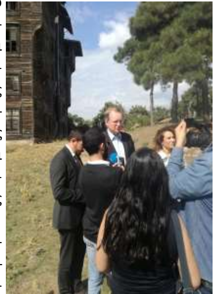
Ο Πρέσβης της Ε.Ε. κ. Christian Berger προβαίνοντας σε δηλώσεις στον περίβολο του Ορφανοτροφείου της Πριγκήπου.

Η ομάδα εργασίας της Οι.Ομ.Κω. συνεχίζει να εργάζεται για το θέμα υποβάλλοντας εισηγήσεις προς την Α.Θ.Π. τον Οικουμενικό μας Πατριάρχη. Σε κάθε περίπτωση και το έργο αυτό χρειάζεται εθελοντικά έργα.