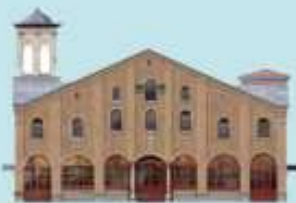
ΜΕΓΑΛΟΝΗΜΟΣ ΚΟΙΝΟΤΗΣ ΣΤΑΥΡΟΔΡΟΜΙΟΥ

Το Κοιμητήριο της Κοινότητας Σταυροδρομίου που βρίσκεται στο Σισλί, λίγο βορειότερα από την πλατεία Ταξίμ, και είναι το μεγαλύτερο ελληνορθόδοξο κοιμητήριο της Κωνσταντινούπολης, αναγνωρίσθηκε από την οργάνωση ASCE ως ένα από τα σπουδαιότερα κοιμητήρια της Ευρώπης με διεθνή εμβέλεια, όπως είναι τα αντίστοιχα της Βιέννης, του Λονδίνου, του Βερολίνου, των Παρισίων, του Μιλάνου κ.ά. Η αναγνώριση αυτή είναι πολύ σημαντική, δεδομένου ότι η ASCE (The Association of Significant Cemeteries in Europe- Ένωση Σημαντικών Κοιμητηρίων της Ευρώπης), είναι ένας μη κερδοσκοπικός οργανισμός με διεθνή ακτινοβολία, ο οποίος συστάθηκε το 2001 στη Μπολώνια της Ιταλίας και αποσκοπεί, κυρίως, στην προστασία, συντήρηση και προβολή σημαντικών κοιμητηρίων της Ευρώπης ως μνημείων του παγκόσμιου πολιτισμού.